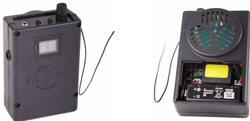
Image de droite : Vue arrière de l'appareil où l'écran doit voir le numéro de la chanson en cours de lecture (il se déconnecte après 15 secondes).

** En appuyant simultanément sur les 2 boutons – et + , on revient au début de la liste des chansons **